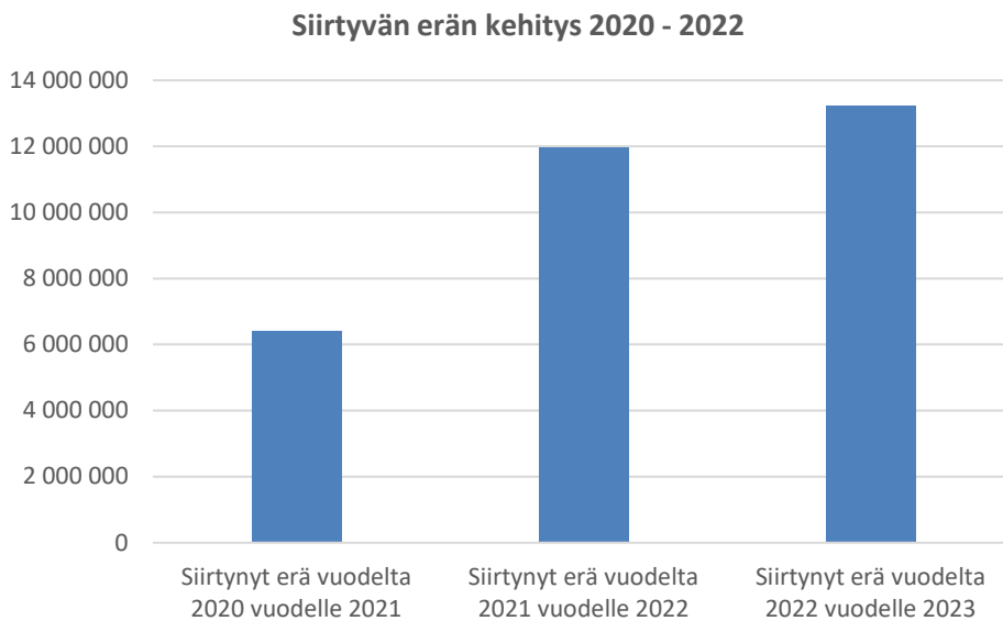
Kuva 2. Siirtyneiden määrärahojen tason kehitys 2020–2022

euroa. Siirtyneen määrärahan taso kasvoi varsinkin vuoden 2021 aikana. Vuodelta 2022 siirtyneiden määrärahojen taso on edelleen varsin korkea, mutta kasvu on hidastunut selvästi.